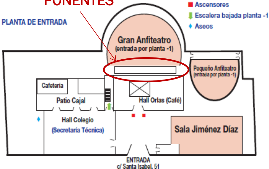
PLANTA DE ENTRADA