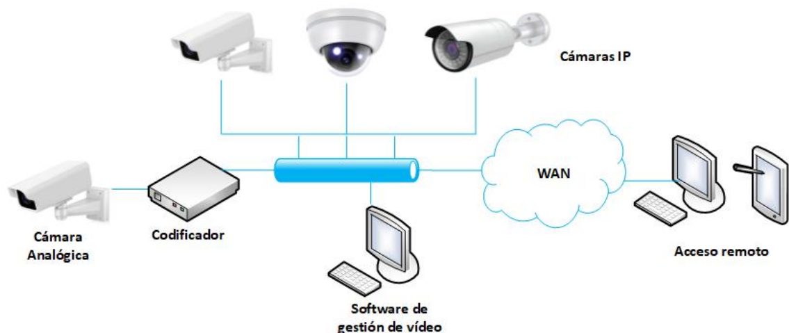
Figura 1 Sistema de vídeo en red.