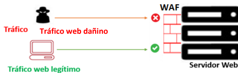
Figura 2: Despliegue de WAF en endpoint