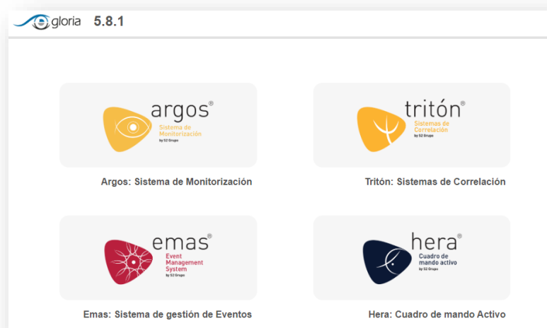
Ilustración 1. Interfaz de acceso de GLORIA